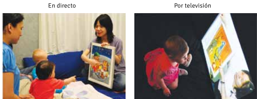
▷ Figura 3b Discriminación fonética del chino mandarín